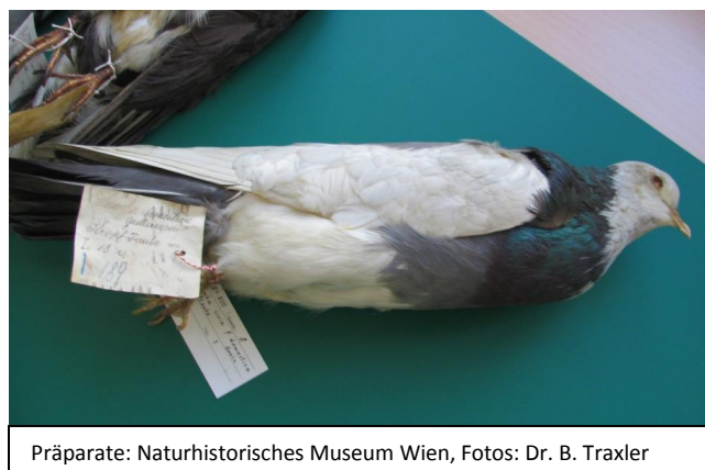
Präparate: Naturhistorisches Museum Wien, Fotos: Dr. B. Traxler