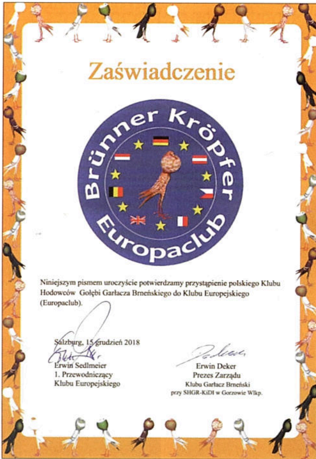
Zaświadczenie przyjęcia do Eu. Klubu G. Brneńskiego