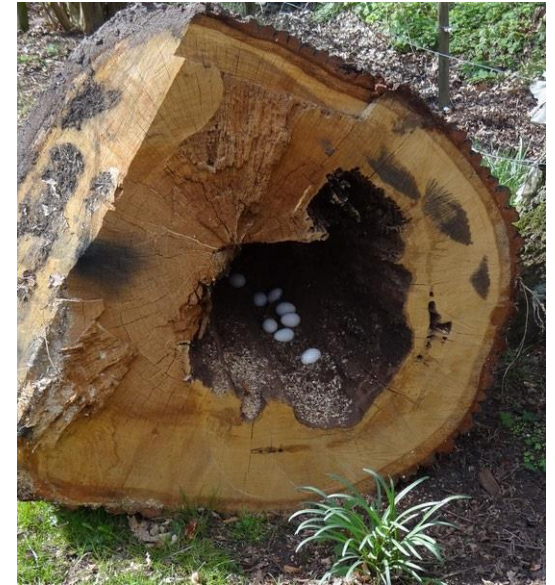
Bei dieser Art von Nest- und Brutpflege, kann natürlich nichts Schlüpfen.